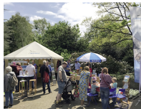
NABU Hannover belebt die Pflanztage.