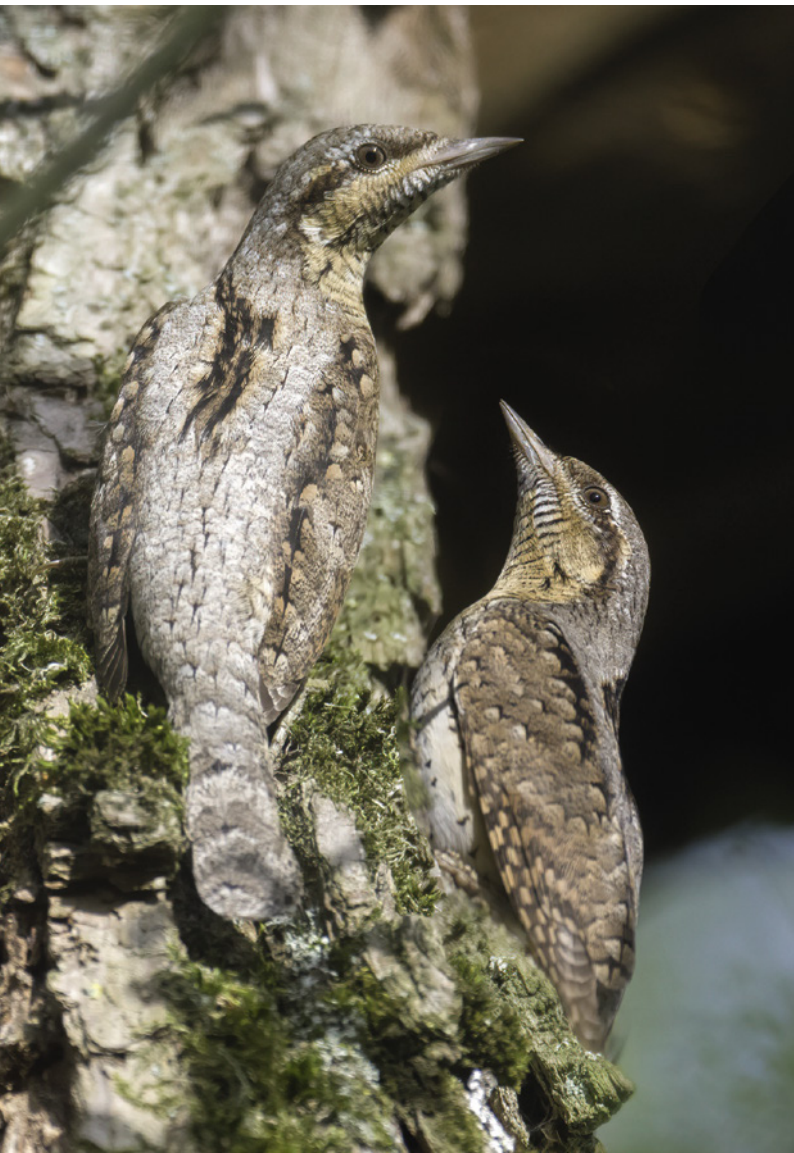
Ein balzendes Paar Wendehälse Jynx torquilla am Badeteich in Laatzen, 22.04.2023.