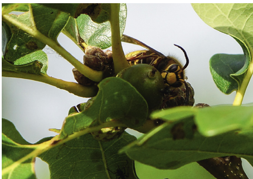
Eine Hornisse beim Aufnehmen von Pflanzensaft.

Stachel mit Widerhaken ausgestattet ist – ihren Stachel mehrmals benutzen und auch ihr Gift dosiert abgeben. Die Hornisse als große Wespe verfügt über einen vergleichsweise langen Stachel. Ihr Gift enthält verschiedene schmerzzeugende Bestandteile. Beide Aspekte führen dazu, dass ein kräftig ausgeführter Hornissenstich unangenehm schmerzhaft ist. Die Giftwirkung ist aber im Vergleich zu anderen wehrhaften Hautflüglern wie zum Beispiel der Honigbiene deutlich geringer.