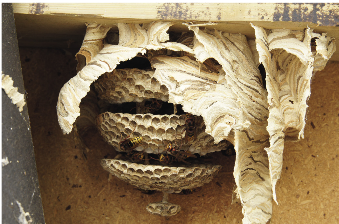
Der Wabenaufbau erfolgt von oben nach unten.

Die zuständige Untere Naturschutzbehörde (UNB) mit ihren haupt- oder ehrenamtlichen Hornissenberater*innen unterstützt vor Ort bei der Aufklärung und der Suche nach Lösungen für Mensch und Hornisse.