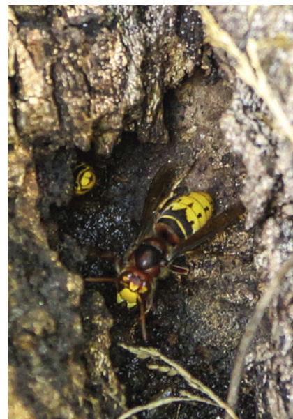
Hornissennest in einer Baumhöhle.

Wussten Sie schon, dass Hornissenstaaten nur einjährig sind? Alte Nester werden im Folgejahr kein zweites Mal besiedelt. Die Gesellschaft von Hornissen ist deshalb (leider) nur von kurzer Dauer. Diese Tatsache erleichtert es Betroffenen aber auch, unter Umständen bestehende Nutzungseinschränkungen aufgrund einer Hornissenbesiedlung für diesen überschaubaren Zeitraum zu akzeptieren.