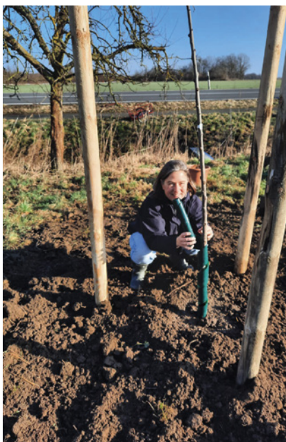
Zusätzliche Obstbäume ...