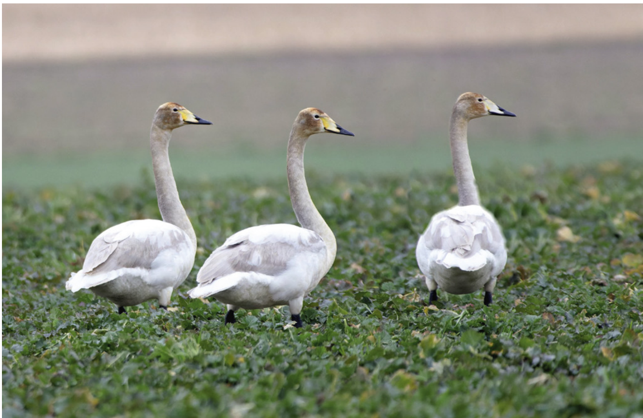
3 der 6 vorjährigen Singschwäne Cygnus cygnus in der Feldmark von Koldingen, 18.02.2023.