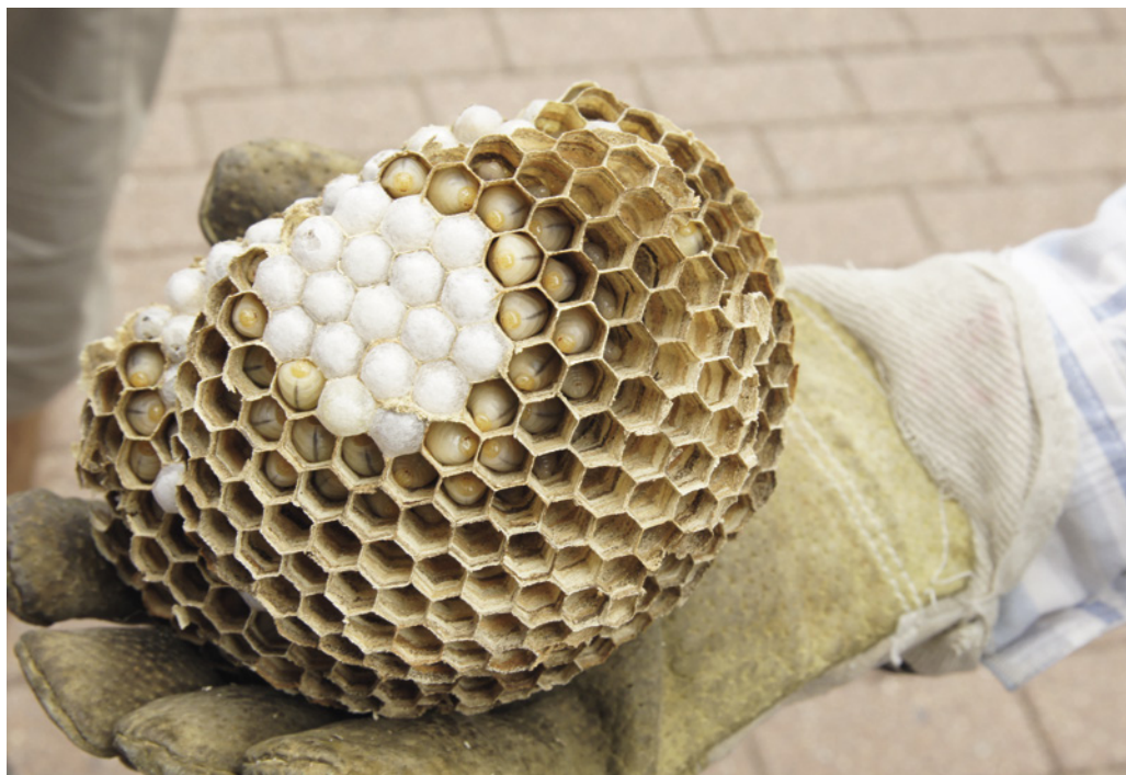
Aus verdeckelten Waben (weiß) schlüpft der Hornissennachwuchs.

Ein durchschnittliches Hornissennest bringt 200 bis 400 Jungköniginnen hervor. Doch gelingt es nur wenigen Königinnen, im kommenden Jahr ein Volk erfolgreich bis zur Entwicklung neuer Geschlechtstiere zu bringen. Rund 95–98 % der geschlüpferten Jungköniginnen versterben bereits während der Überwinterung an Krankheiten, Pilzbefall oder werden gefressen. Weitere Verluste nach der Überwinterung folgen aus Revierkämpfen, durch Fressfeinde, Gifte und andere Gefahren. Es ist also nicht zu befürchten, dass der Garten des mensch-