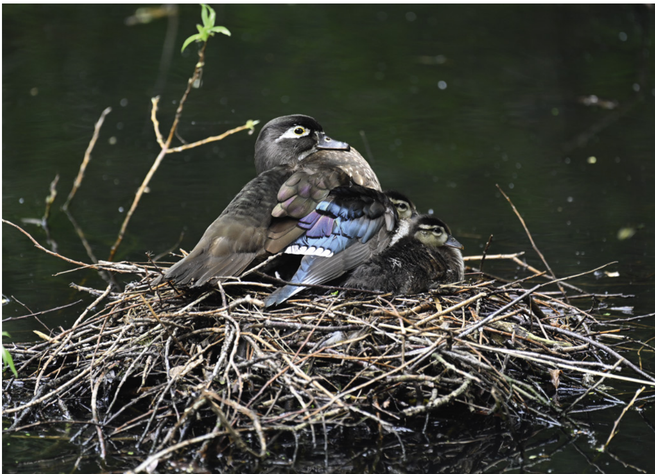
Zweiter Brutnachweis der Brautente Aix sponsa in der Stadt Hannover, 01.06.2023, Annateich.