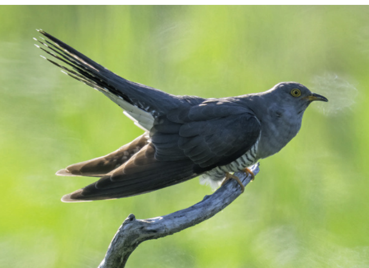
Ein männlicher Kuckuck Cuculus canorus am 15.06.2022 an den KT Weetzen.