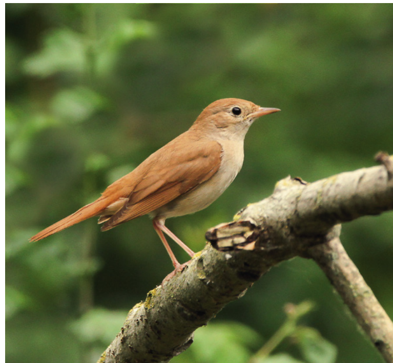
Nachtigall Luscinia megarhynchos in ihrem Brutrevier im NSG „Ruthe-Koldingen“.

Nachtigall Luscinia megarhynchos (-/V): Die erste Nachtigall fiel durch ihren zaghaften Gesang am 10.04. in Laatzen kaum auf. Vorkommensschwerpunkte mit 6–11 Sängern waren der Golfplatz Isernhagen, die Wülfeler Wiesen, Laatzen und das NSG „Leineau zw. Ruthe u. Koldingen“ (Preisegger, Kloas, Prah u. a.). Bruterfolge gab es im Raum Isernhagen, Dolgen und aus dem innerstädtischen Bereich von Ahlem und Ricklingen (Thye, Steinmetz, Denker, Dierken).