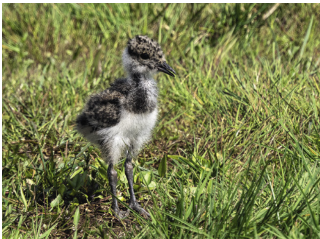
Vor einer unsicheren Zukunft. Junger Kiebitz Vanellus vanellus, 27.05.2023.