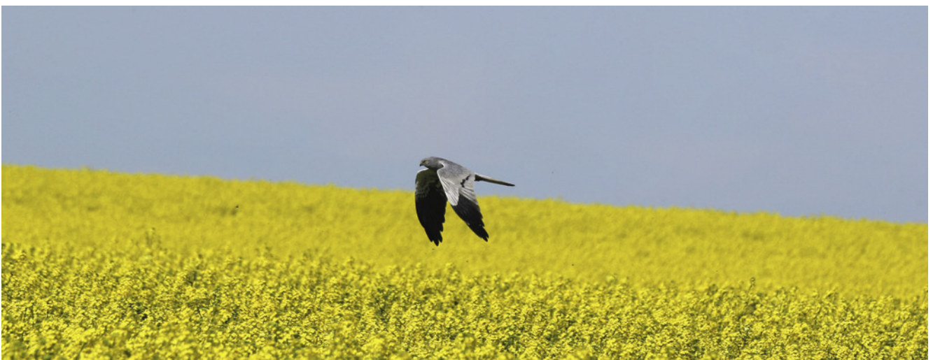
Männliche ad. Wiesenweihe Circus pygargus im Flug, Haimar, 09.05.2021.