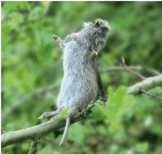
Der Neuntöter Lanius collurio spießt seine Beute bei Nahrungsüberschuss auf, um Depots für schlechte Zeiten anzulegen. Im Bild eine Maus, 29.07.2023.