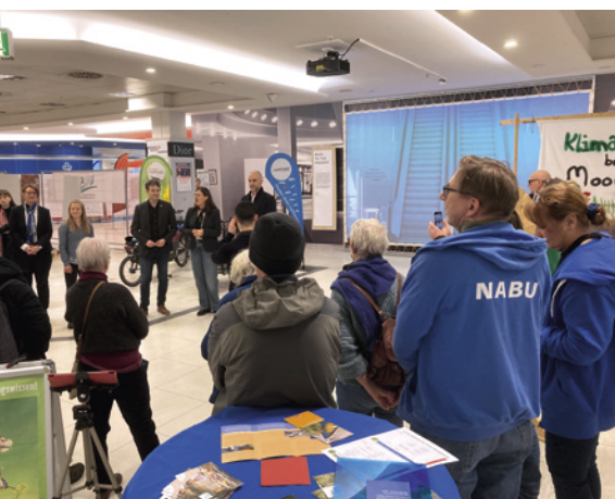
Oberbürgermeister Belit Onay begrüßt die Ehrenamtlichen bei der Klimaaktionswoche im „aufhof“.

Nachdem wir erfolgreich mit einer „Zugabenwoche“ im „aufhof“ ins Jahr 2024 gestartet sind, kann sich Hannover wieder auf viele naturinspirierende Veranstaltungen von uns freuen. Am 12.5.–13.5. werden wir im Rahmen der Stunde der Gartenvögel mit unserer morgendlichen Aktion in der Waldstation sein (siehe auch der Artikel von Birgit Riethmüller). Danach stehen wir fast schon traditionell als Gast bei unserem Landesverband bei den Pflanztagen im Stadtpark Hannover im Schatten des Kuppelsaals und werben für die größte Vogelzählung im Bundesgebiet. Auch hoffen wir natürlich, dabei neue Aktive begrüßen zu dürfen. Am 2.6. und 3.8. zum Insektensommer (der Ort wird noch bekannt gegeben) begrüßen wir Groß und Klein zum Mitmachen bei der größten Insektenzählaktion deutschlandweit.