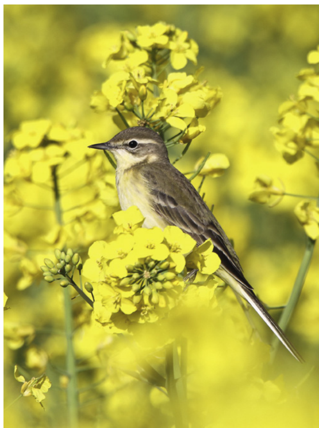
Weibliche Wiesenschafstelze Motacilla flava am 03.05.2023 im NSG „Ruthe-Koldingen“.