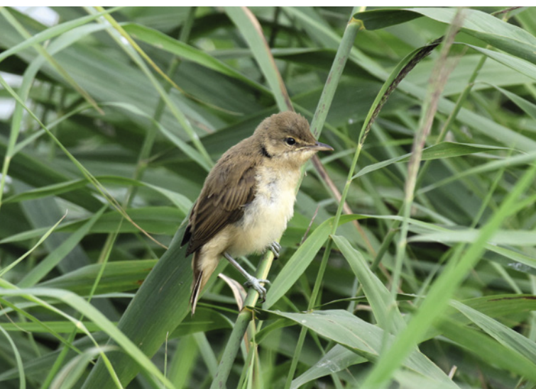
Brutnachweis! Flügger Drosselrohrsänger Acrocephalus arundinaceus am 25.07.2023 an den KT Lehrte.