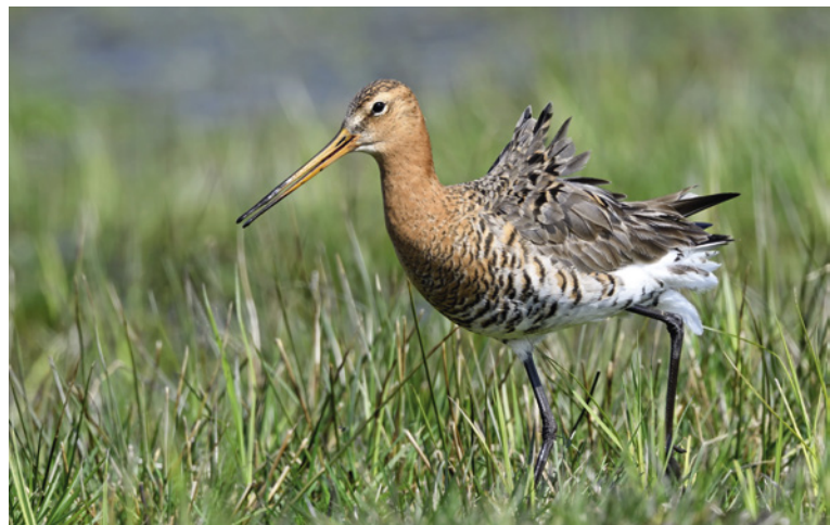
Männliche Uferschnepfe Limosa limosa am Dämmer, 07.04.2023. Dort lassen sich die Vögel auch auf nähere Distanz gut beobachten bzw. fotografieren.