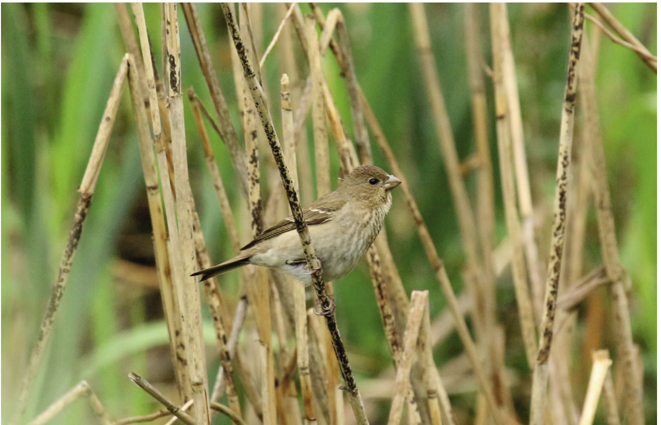
Männlicher K2-Karmingimpel Carpodacus erythrinus an den KT Lehrte. K2-Männchen schauen in diesem Kleid wie Weibchen aus und sind nur durch Gesang zu unterscheiden.

Alpenbirkenzeisig Carduelis flammea : Generell wurden nur wenige Sichtungen für das Frühjahr mitgeteilt. Lediglich am Maschsee fiel dabei im April auch ein singendes Männchen auf (Dierken). Daher gab es auch keinerlei Hinweise auf mögliche Brutvorkommen.