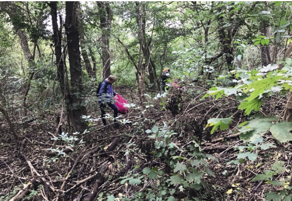
Am Südschnellweg, noch gibt es Bäume.