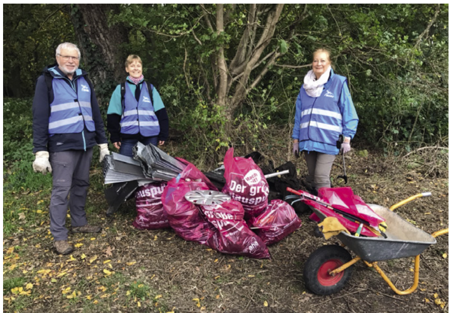
Fette Beute, aber das war noch nicht alles.

Freiwillige sind herzlich willkommen. Meldet Euch unter agmuell.nabuhvv@web.de .