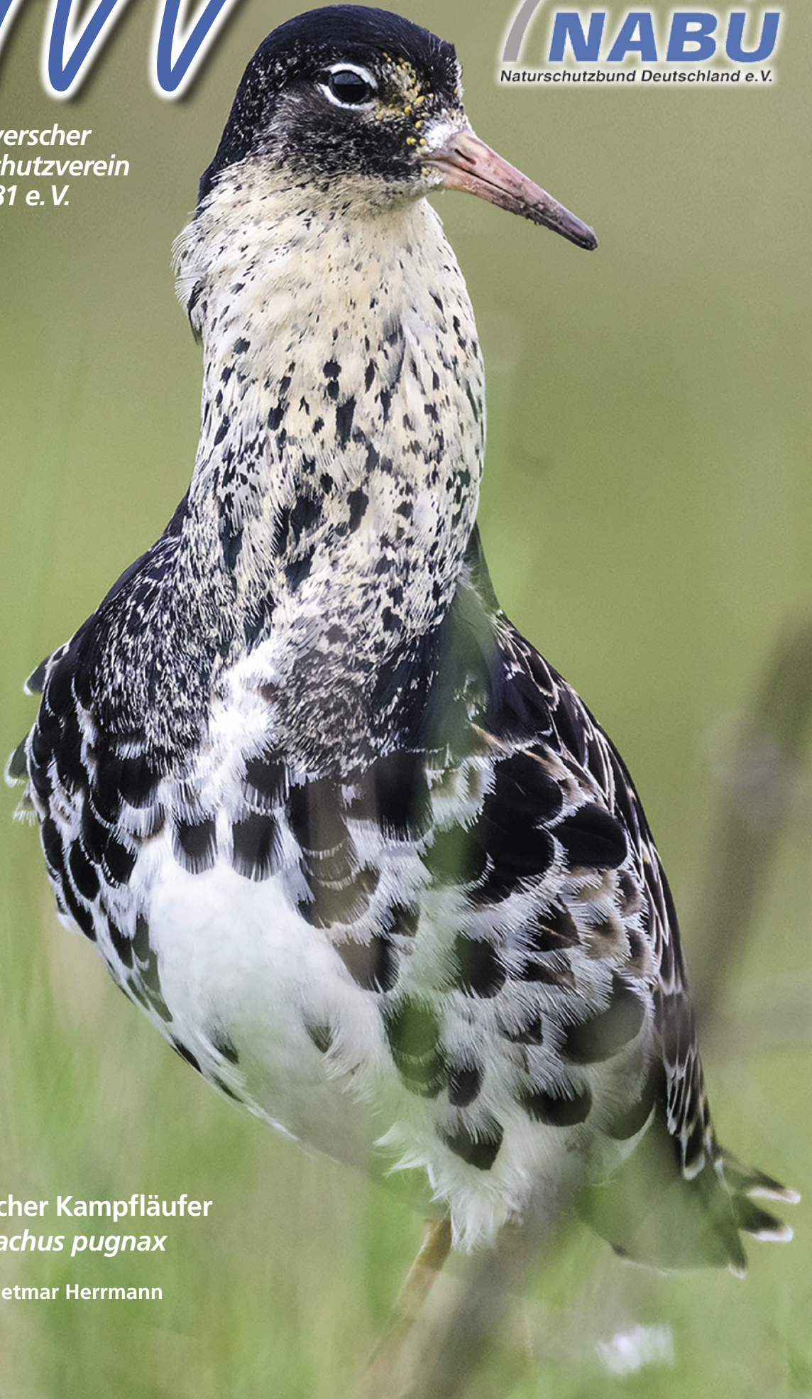
Männlicher Kampfläufer Philomachus pugnax

Hannoverscher Vogelschutzverein von 1881 e. V.