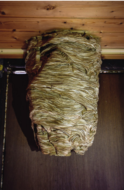
Ein voll ausgebildetes Hornissennest.

in ihrer unmittelbaren Nachbarschaft zu tolerieren. Wie sieht das Hornissenjahr eigentlich aus?