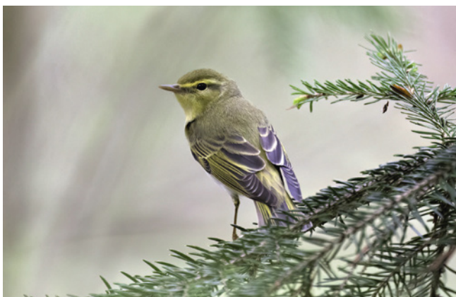
Ein Waldlaubsänger Phylloscopus sibilatrix im Nationalpark Harz, 21.05.2023.