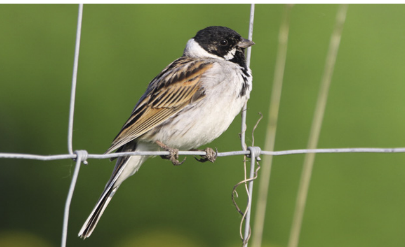
Männliche Rohrammer Emberiza schoeniclus in der Feldmark von Gleidingen, 13.05.2023.