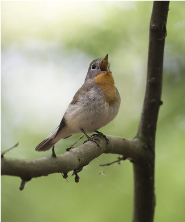
Star des Frühjahrs! Singender Zwergschnäpper Ficedula parva am 29.05.2023 bei Badenstedt.