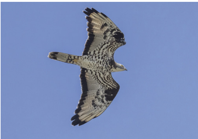
Durchziehender Wespenbussard Pernis apivorus, 08.05.2023.