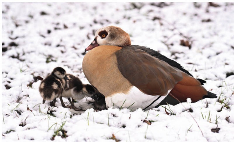
Ab unter Mama. Junge Nilgänse Alopochen aegyptiacus trotzten dem Wintereinbruch am 09.03.2023 im Tiergarten.