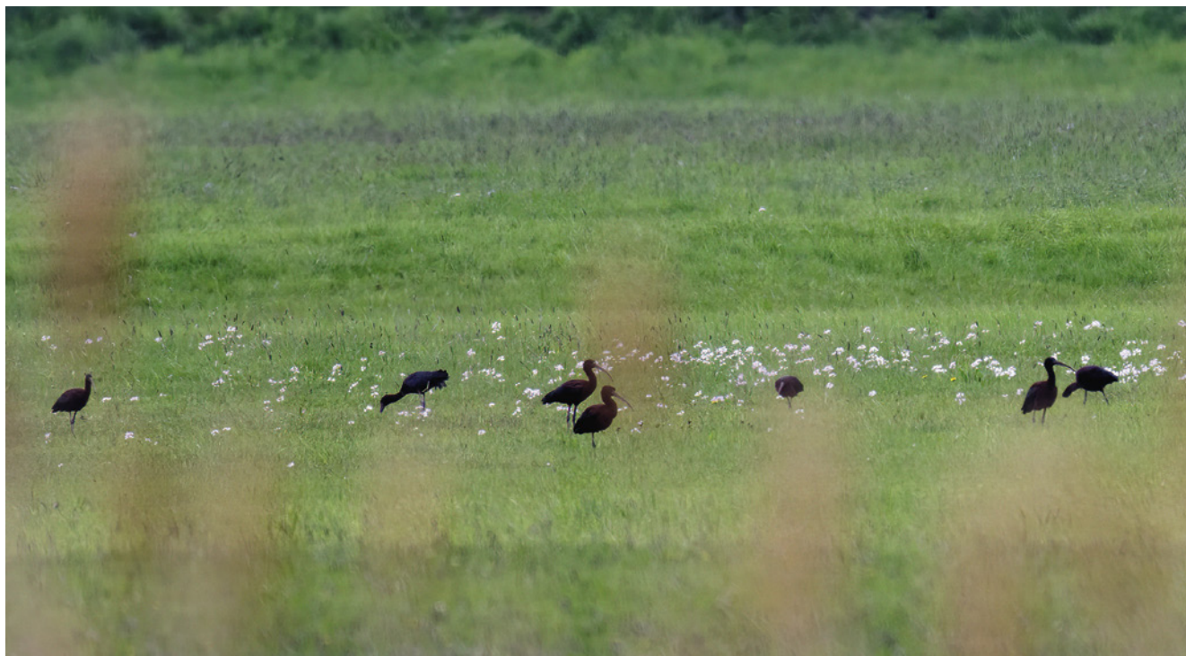
Der 7er Trupp Sichler Plegadis falcinellus am 29.04.2023 im NSG „Alte Leine“.