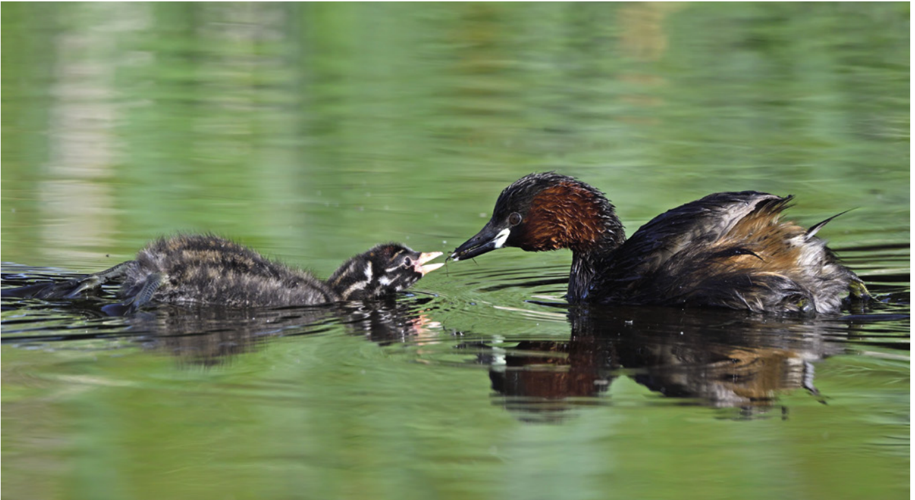
Zwergtaucher Tachybaptus ruficollis : Altvogel füttert juv.