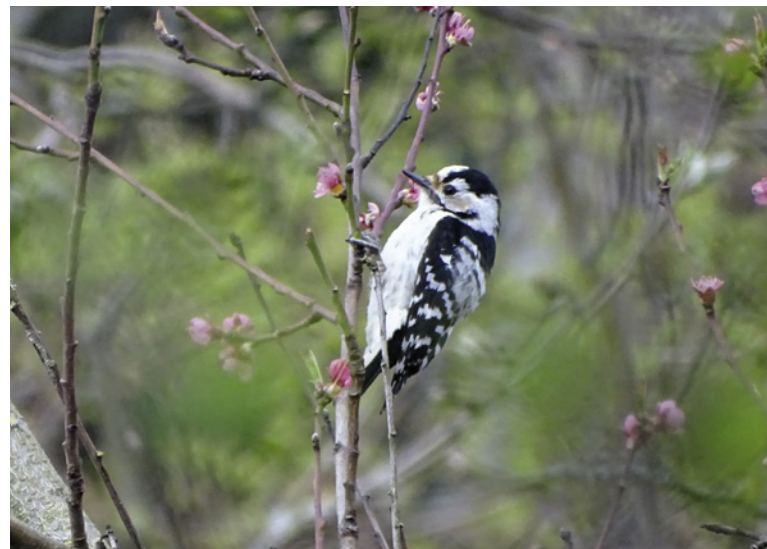
Weiblicher Kleinspecht Dryobates minor in der Leineae bei Ahlem, 14.04.2021.