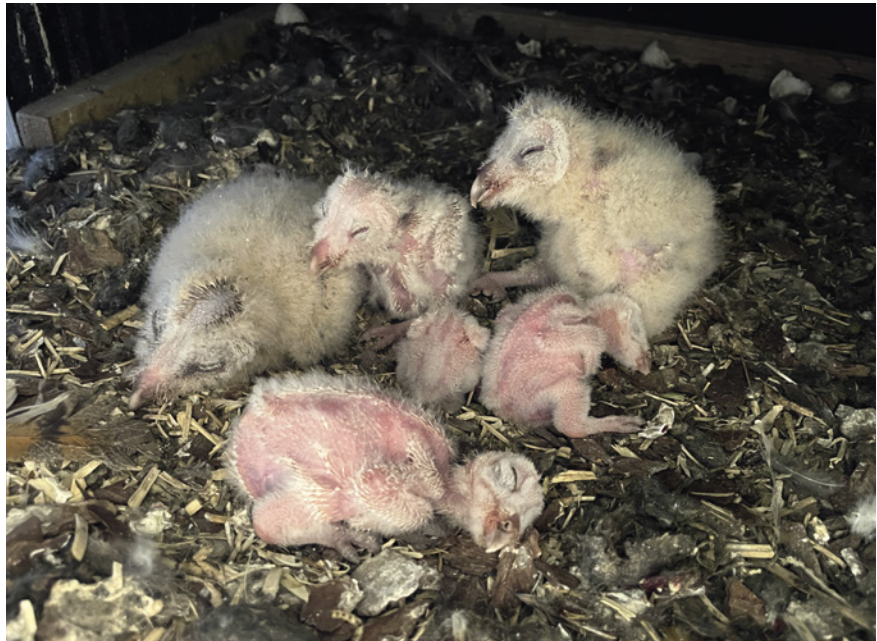
Noch sehr kleine Schleiereulenpulli, 1–10 Tage alt (Lehrte).

Gefreut hatten wir uns zunächst, dass es endlich mal wieder eine Zweitbrut gab. In Gretenberg hatte ein Schleiereulenpaar im Frühjahr 5 Junge großgezogen. Bei der Kontrolle im August fanden wir im selben Nistkasten ein Dreiergelege. Das zugehörige Weibchen war aber nicht das aus der