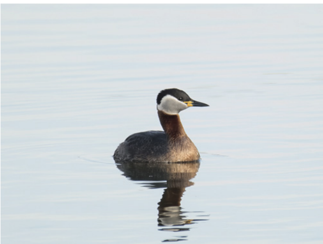
Adulter Rothalstaucher Podiceps grisegena in seinem Brutgebiet an den KT Lehrte, 22.04.2023.