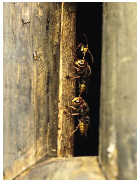
Einflugkontrolle durch Wächterinnen.

Aus Angst vor diesen imposanten Tieren sind viele Menschen nicht bereit, die Hornissen in ihrem Lebensbereich zu dulden. Deshalb hat der Gesetzgeber sie unter einen besonderen Schutz gestellt. Die Störung oder gar Tötung von Hornissen sowie auch die Beeinträchtigung oder Zerstörung ihrer Lebensstätten ist gesetzlich untersagt. Während die Honigbiene willkommen geheißen wird und immer mehr Hobbyimker*innen Bienenvölker im Garten und auf dem Balkon halten, tun sich die Menschen schwer, die Hornissen