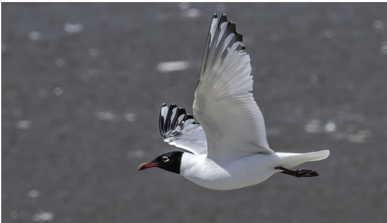
K3-Schwarzkopfmöwe Larus melanocephalus in der Lachmöwenkolonie am Eidersperrwerk in Schleswig-Holstein, 08.05.2023. K3-Vögel lassen sich meist nur durch ihre noch schwarzen Flügelspitzen von Altvögeln unterscheiden.