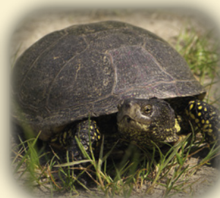
Adultes Sumpfschildkrötenweibchen.