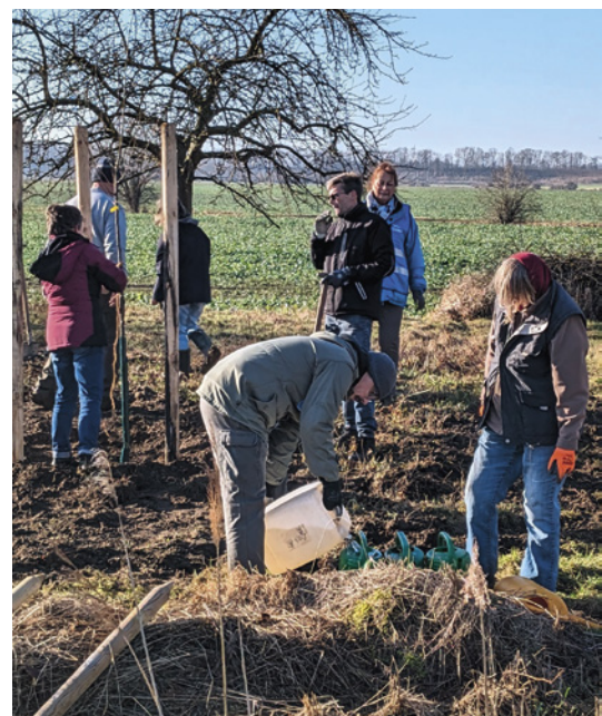
... für Sehnder Streuobstwiese.