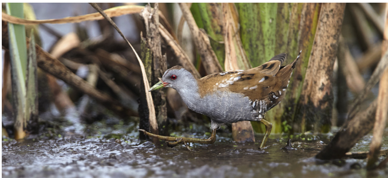
Männliches Kleines Sumpfhuhn Porzana parva in seinem Brutgebiet auf Nahrungssuche, Groß Rosin, Mecklenburg-Vorpommern.