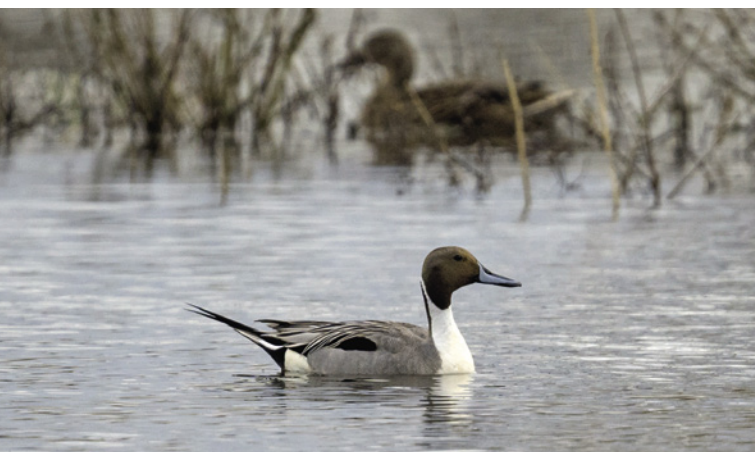
Männliche Spießente Anas acuta im PK im NSG „Alte Leine“, 19.03.2023.