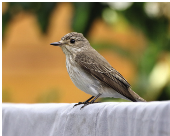
Grauschnäpper Muscicapa striata in einem Kleingarten in Hannover, 27.06.2023.