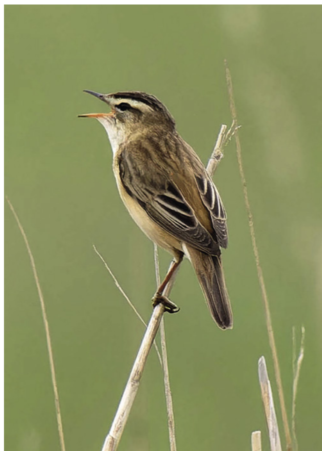
Singender Schilfrohrsänger Acrocephalus schoenobaenus, 22.05.2023.