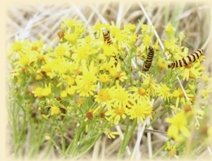
Raube des Blutbären auf Jakobs-kreuzkraut.