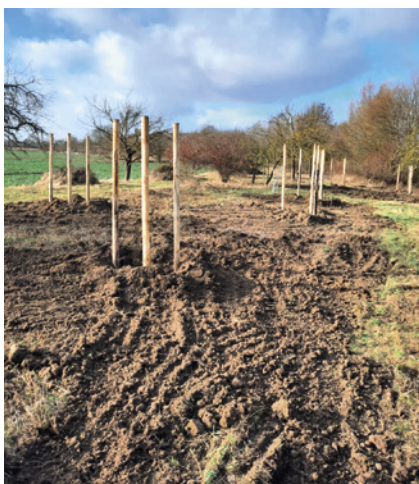
Pflanzaktion bei klarem ...

Vor etwa 30 Jahren hatte die Stadt Sehnde die Wiese angelegt und sich selbst überlassen. Seit 2019 hat der NABU AG Sehnde den Pflegeauftrag, und im Laufe des letzten Jahres hat sich herausgestellt, dass bei der Bepflanzung noch Luft nach oben ist. Die Obstbäume sind in die Jahre gekommen und ein bisschen mehr Abwechslung bzw. Erneuerung tut der Streuobstwiese gut.