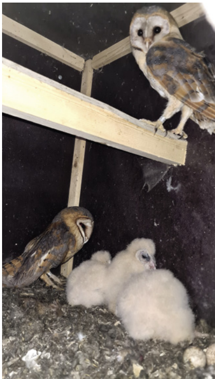
Ein eher seltener Anblick einer kompletten Schleiereulenfamilie (Ahlten).

ersten Brut, es trug keinen Ring. Bei der Erstbrut hatten wir das Weibchen neu markiert. Leider war die Zweitbrut nicht erfolgreich. Beim Beringungstermin fanden wir nur einen toten Jungvogel im Kasten.